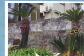
太海には素敵なカフェがいっぱい。お気に入りのカフェを見つけてはいかがですか。