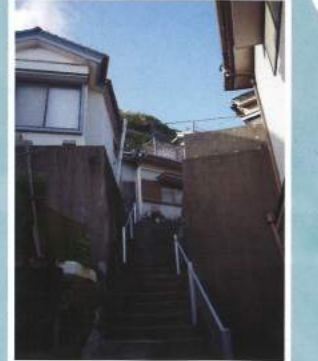
浜波太の迷路のような路地