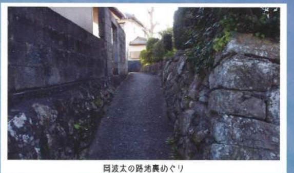
同波太の路地裏めぐり